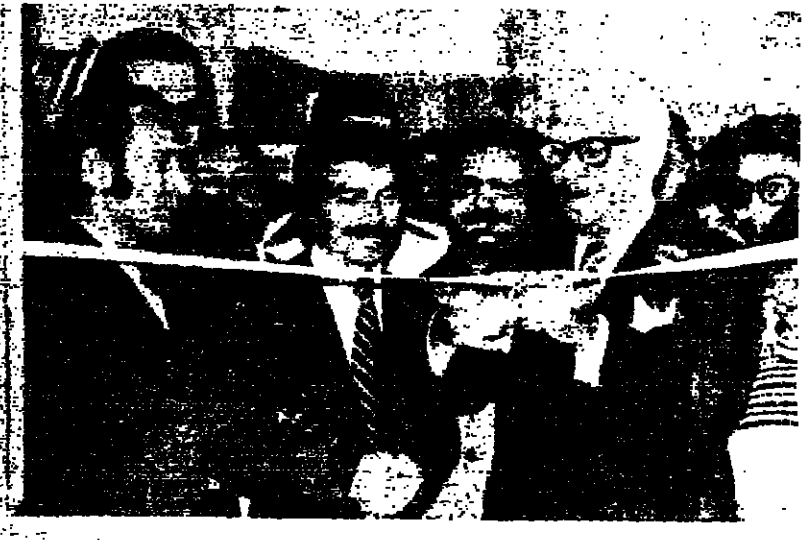
رئيس بلدية زحلة يقص الشريط مختما المعرض الفني الدائم